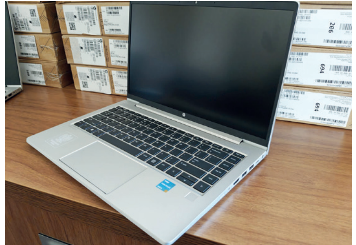
Z tych laptopów skorzystają uczniowie z naszej gminy