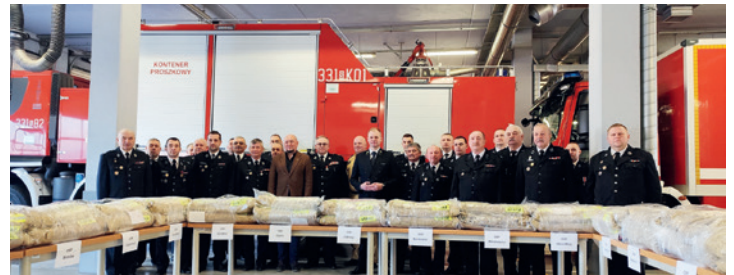
Strażacy i otrzymany sprzęt

19 marca w budynku Komendy Miejskiej PSP w Bielsku-Białej miało miejsce przekazanie sprzętu ochrony osobistej (ubrania typu Nomex i koszarowe), zakupionego dzięki wsparciu finansowemu Grupy PKP. Z gminy Bestwina otrzymały go OSP Bestwina, OSP Bestwinka i OSP Janowice. Sprzęt pozwoli jeszcze lepiej zabezpieczyć strażaków z OSP podczas działań ratowniczych.