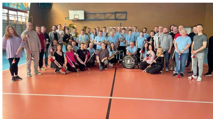
Szkolenie dla tamburmajorów

sjonalne prezentacje, warsztaty dyrygenckie, zajęcia z zakresu musztry oraz praktyczne szkolenia dla sekcji perkusyjnych.