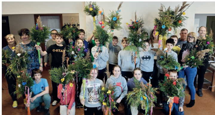
Uczniowie z Janowic i ich wielkanocne palmy

W poniedziałek poprzedzający Niedzielę Męki Pańskiej czyli Niedzielę Palmową, uczniowie szkoły podstawowej w Janowicach wykonali własnoręcznie oryginalne palmy, składające się w większości z naturalnych składników (wierzba, śliwa, trzcina, żywotnik).