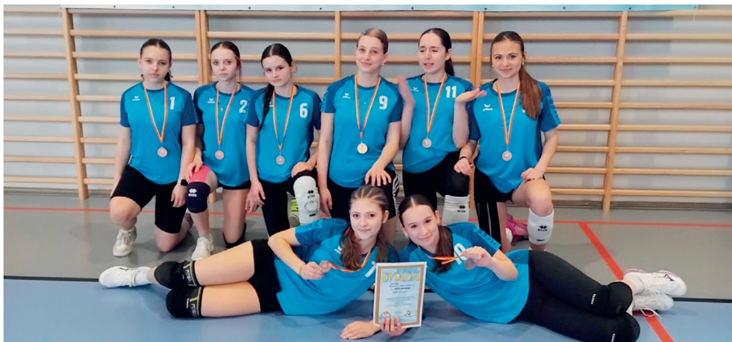
Zawodniczki z SP Bestwina