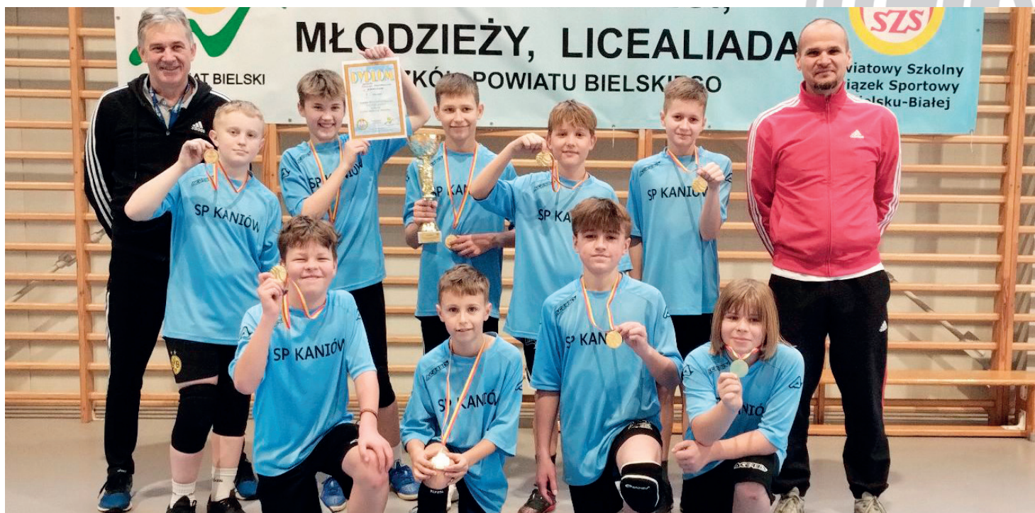
Drużyna siatkówki SP Kaniów