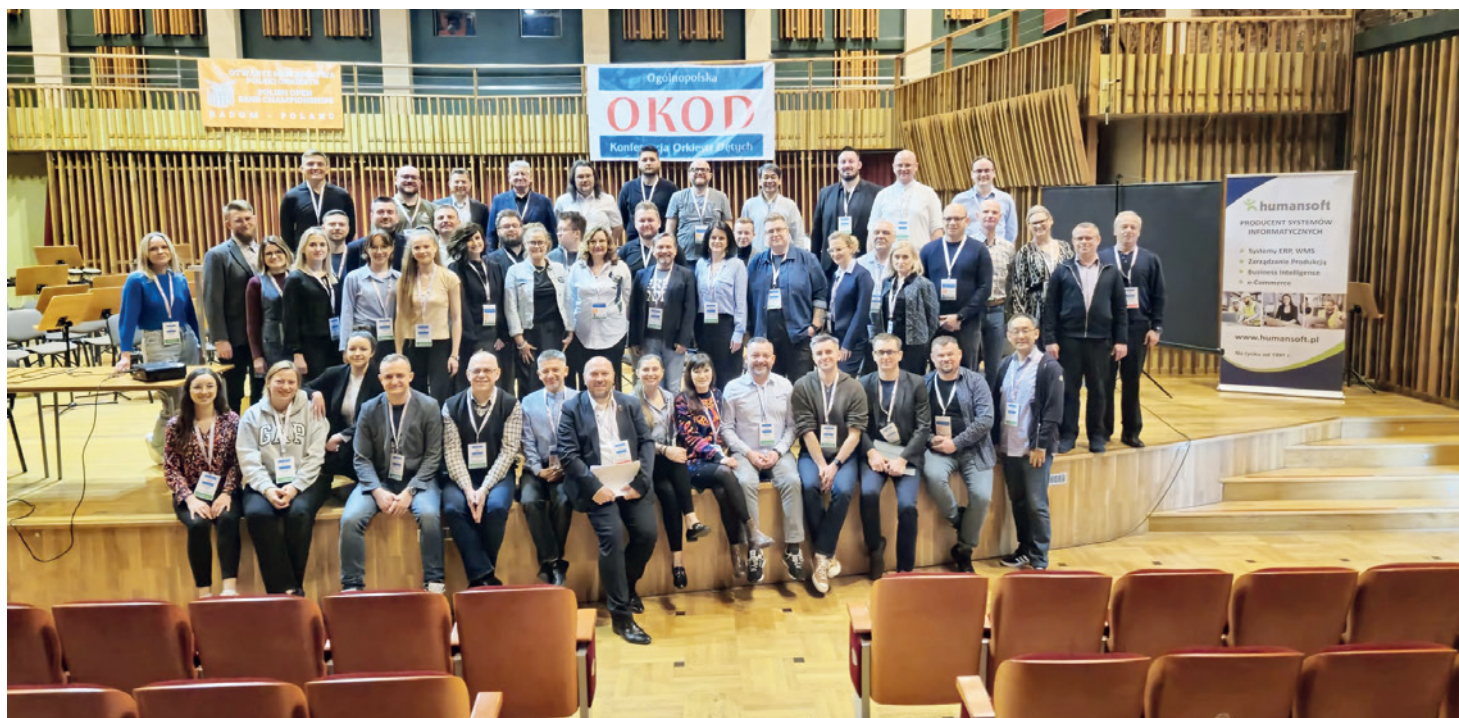
Konferencja OKOD 2025

Orkiestra Dęta Gminy Bestwina z siedzibą w Kaniowie nieustannie inwestuje w rozwój swoich muzyków, stawiając na profesjonalne szkolenia i warsztaty. W marcu reprezentanci zespołu mieli okazję uczestniczyć w prestiżowych wydarzeniach, które przyczynią się do podniesienia poziomu artystycznego i organizacyjnego całej grupy.