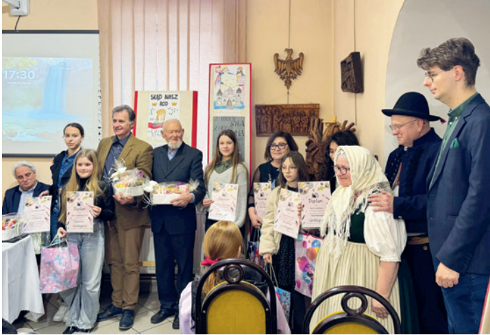
Spotkanie w Muzeum Regionalnym - podsumowanie konkursu plastycznego

5 kwietnia 2025 roku w sobotnie popołudnie stowarzyszenie zwykle „Lachy wczoraj i na wieki” we współpracy z GOK-iem oraz Muzeum Regionalnym im. ks. Zygmunta Bubaka w Bestwinie zorganizowało spotkanie rozpoczynające obchody jakże ważnego dla każdego Polaka jubileuszu.