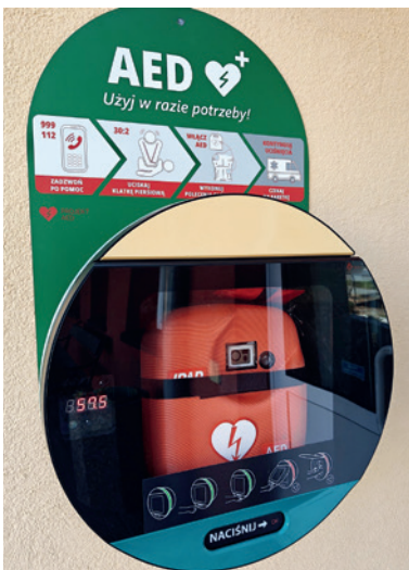
Jeden z zamontowanych defibrylatorów

We wszystkich sołectwach gminy Bestwina zamontowane zostały cztery urządzenia typu AED – defibrylatory CU Medical iPad SP1 i kapsuły DefibSafe (DS3) . Środki na zakup tego sprzętu pochodziły z budżetu gminy Bestwina. Całkowity koszt to 28 tys. zł.