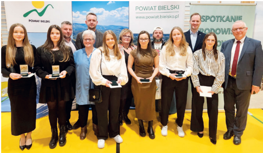
Sportowcy z gminy Bestwina nagrodzeni na gali